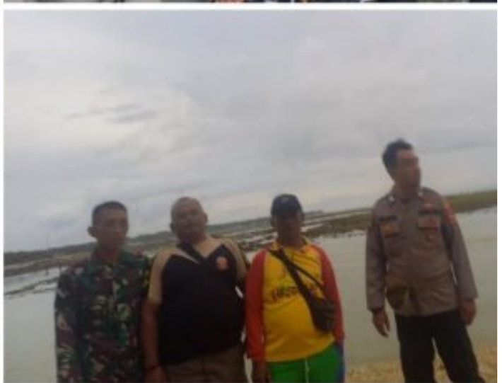
Situasi Aman dan Kondusif di Pos Pam Wisata Ujunggenteng-Cibuaya Pengamanan Natal dan Tahun Baru 2024/2025 Bersama Polsek Ciracap Polres Sukabumi